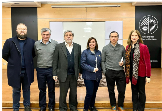
[Congresos y Seminarios]

Boletín N°52 ESPECIAL CONSTITUCIÓN Centro Interdisciplinario de Políticas Públicas, CiPP