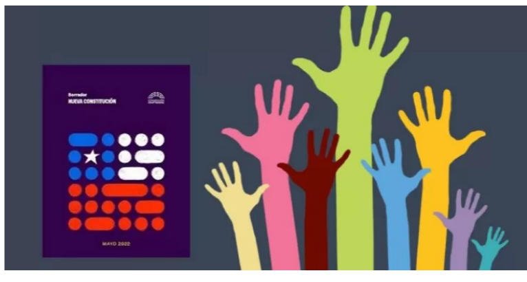
[Columna de Opinión]