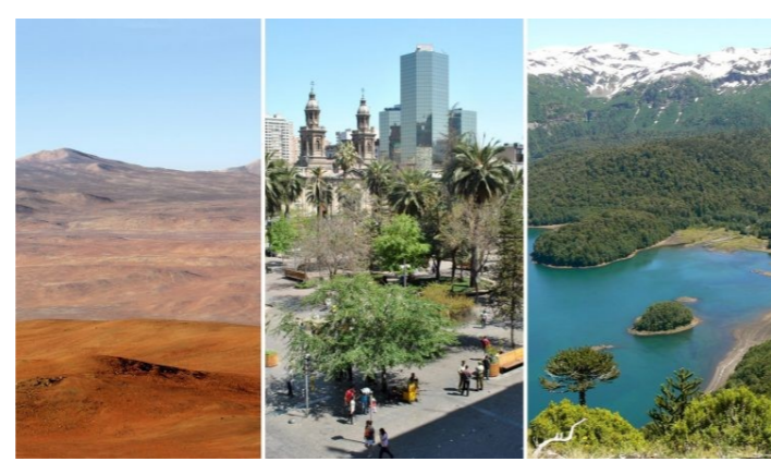
[Congresos y Seminarios]

Enrique Rajevic: "en materia de organización territorial, la propuesta constitucional alude a una regulación mucho más profunda y una estructura diferente a la actual, con el sello de lo regional y lo comunal" .