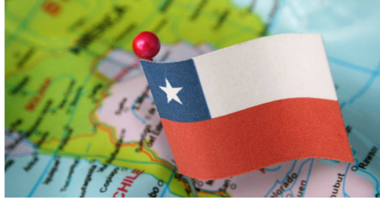
[Artículo de Extensión]

Eduardo Saavedra: "(...) hay un continuo de opciones entre la Constitución vigente, polarizada hacia los derechos individuales, y la propuesta de nueva Constitución, polarizada hacia los derechos sociales y colectivos..." .