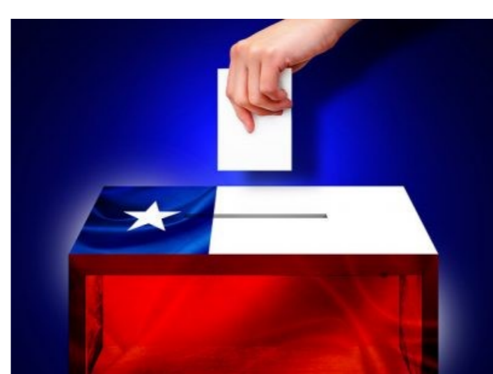
[Artículo de Extensión]