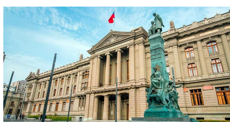
[Congresos y Seminarios]

Rafael Blanco: "El texto que se propone va a requerir reformas si es aprobado para que realmente garantice un genuino sistema democrático de distribución de poder" .