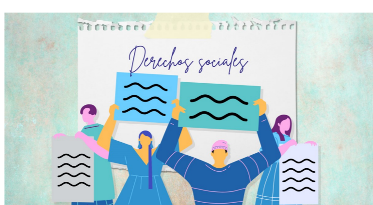
[Artículo de Extensión]

Paola Bordón: "La propuesta constitucional no condiciona los derechos sociales a la disponibilidad de recursos del país generando sobre expectativas" .