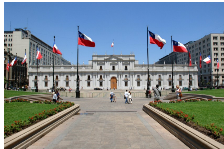
[Columna de Opinión]